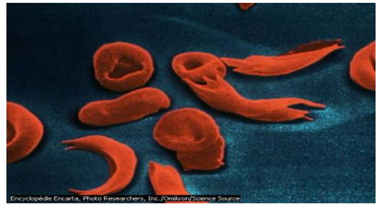
الشكل أ: كريات الدم الحمراء لأحمد