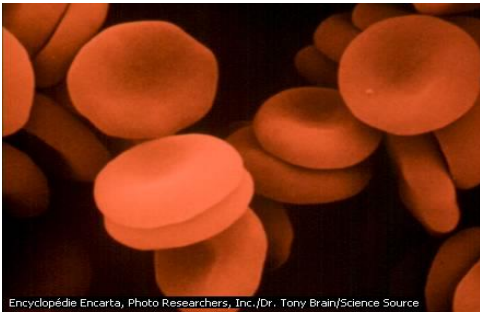
الشكل ب: كريات دم حمراء عادية